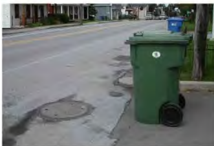
Voici la bonne façon de placer le bac en bordure de la route.

L'occupant est responsable de retirer de la rue le bac utilisé pour l'entreposage des matières résiduelles et de le remiser, avant 21 h le jour de la collecte, soit dans la cour arrière ou latérale de l'immeuble desservi.