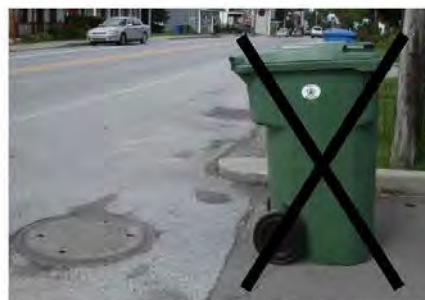
Bac placé du mauvais côté, le couvercle risque d'être brisé ou de rester ouvert une fois vidé.